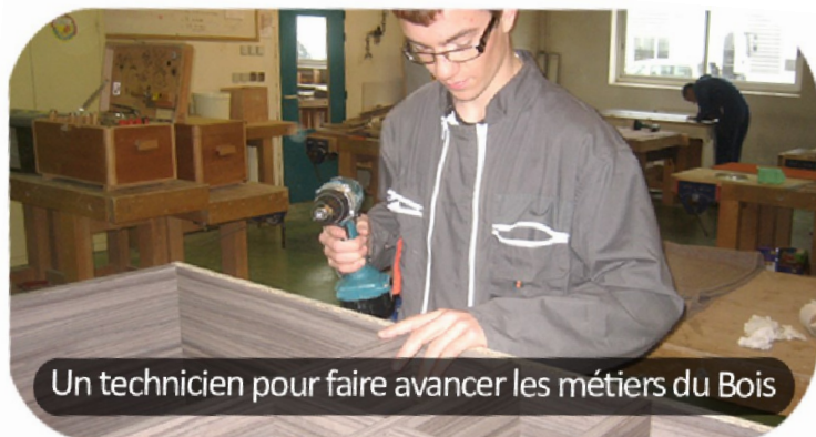
Un technicien pour faire avancer les métiers du Bois